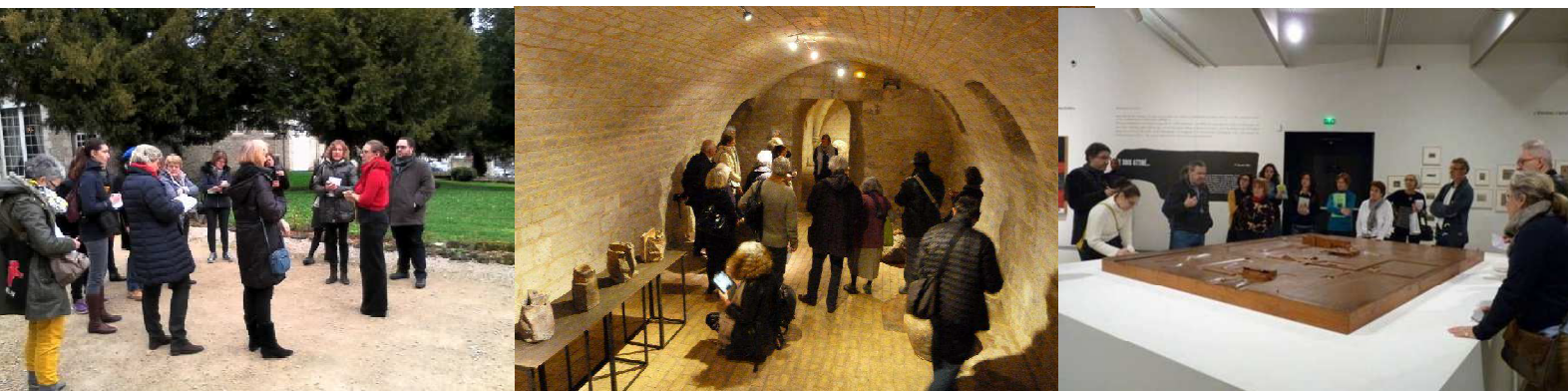
Visites et formations @ancovart