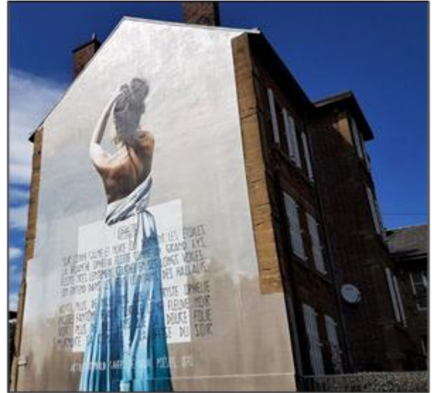
« Ophélie » Fresque de 2017