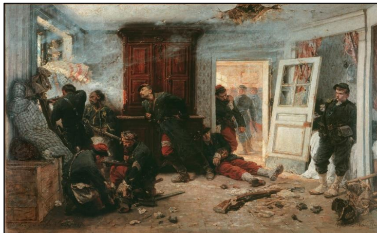
Les Dernières cartouches par Alphonse de Neuville

Repas réalisé par un traiteur et livré au musée.