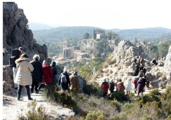
L'étude d'un site naturel peut être physique! 2015 : Cirque de Mourèze