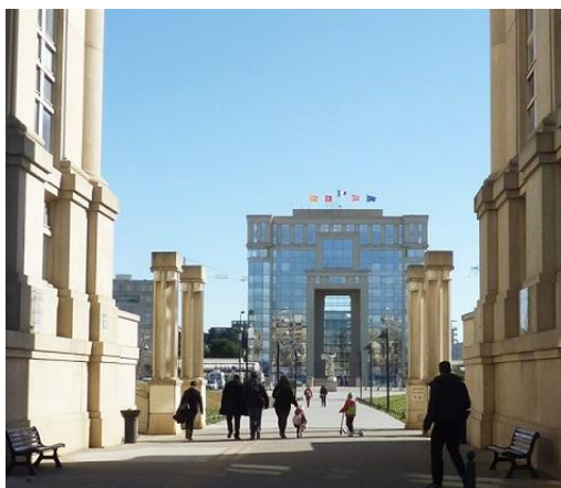
Montpellier, Hôtel de région